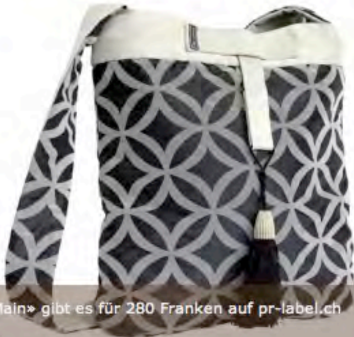
Die Tasche «My Main» gibt es für 280 Franken auf pr-label.ch